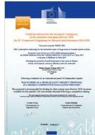
European Commission Excellence Award (2017).