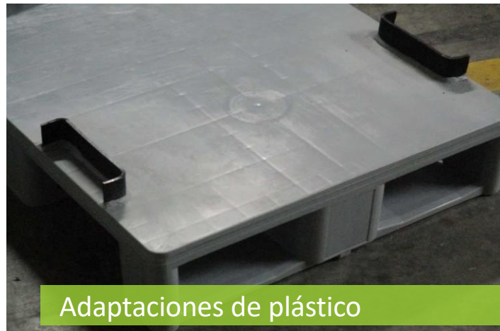
Adaptaciones de plástico