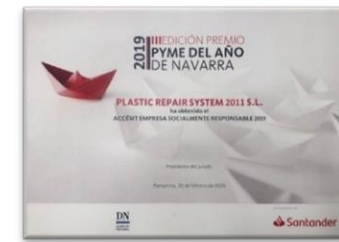
Socially Responsible Company Award (2020).