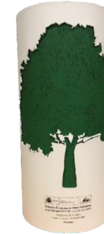
European Environment Award for Companies in Spain (2018).