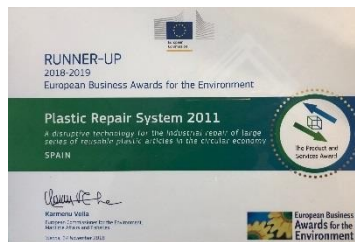
European Environment Award, European phase (2018).