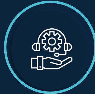
Centro de atención a usuarios