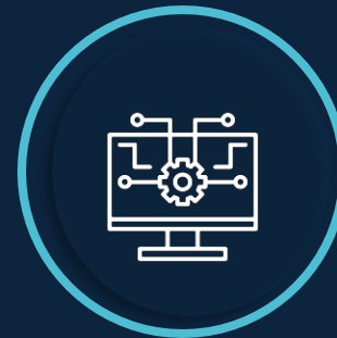
Fábrica de software