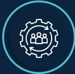
Operación y mantenimiento de instalaciones