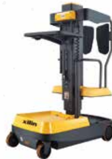
RECOLECTOR DE PEDIDOS