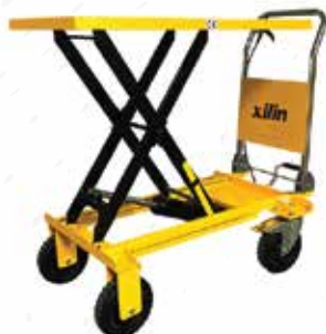
MESA DE ELEVACIÓN