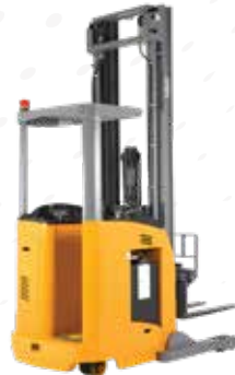
MONTACARGAS HOMBRE PARADO